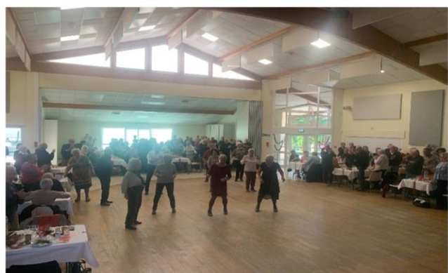
Samedi 13 décembre 2025 repas des aînés dans la salle des fêtes