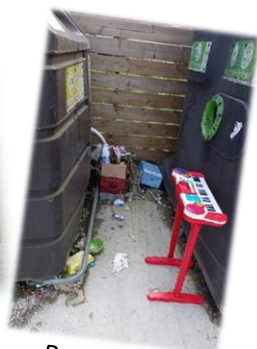
Rue du port

Nous n'hésiterons pas à verbaliser ce genre de geste ; autrement dit nous appliquerons la loi . Voici l'infographie de Service-Public.fr à ce sujet :