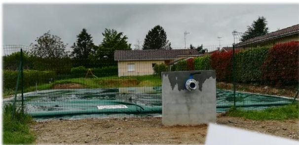
Réserve Alimentée, rue Lavison

Local du Service Technique : aménagement d'une salle à manger pour le personnel, puis construction d'un vestiaire dames.