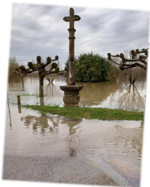
Février 2021 : Crue historique de la Garonne dont l'intensité a fait ressurgir les souvenirs de celle de décembre 1981