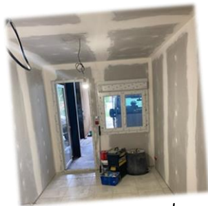
Aménagement du local du personnel