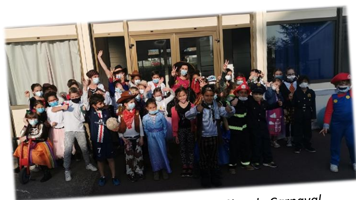
Des petits écoliers heureux de fêter le Carnaval à l'école et au périscolaire