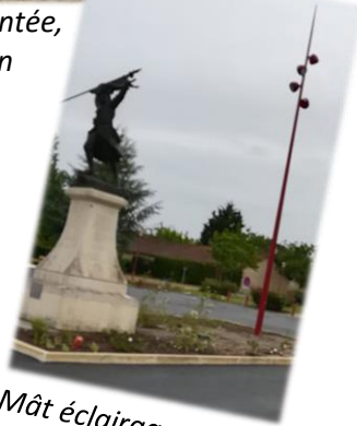
Mât éclairage public, place de la mairie

Nous allons procéder à une modernisation de l'éclairage des bâtiments communaux . Il s'agit d'installer des éclairages LED . Cela rentre dans le cadre des économies d'énergie à gain rapide pour lequel la commune bénéficie d'une subvention à hauteur de 60%. D'autre part, une importante campagne de changement de l'éclairage public étalée sur trois ans va aussi démarrer. Une première tranche a été définie et devrait être réalisée en 2021 pour le passage en LED de l'éclairage public .